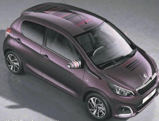
Abb. enthält Sonderausstattung.