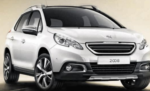
Abb. enthält Sonderausstattung.

DER NEUE CROSSOVER PEUGEOT 2008 IHR NEUER WEG DURCH DIE STADT.